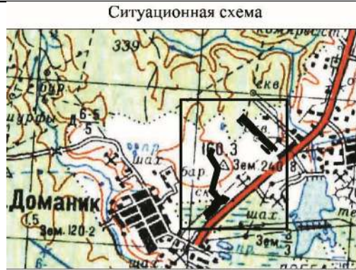
Схема расположения земельного участка на кадастровом плане территории муниципального образования. Объект: «Обустройство Ярегского нефтяного месторождения в границах лицензионного участка ООО «ЛУКОЙЛ-Коми». ПС 110/35/6Кв «Верховье» Внеплощадочные сети и коммуникации) Местоположение: Республика Коми, МОГО «Ухта», пгт. Ярега Кадастровый квартал: 11:20:1001001; 11:20:1001003. Площадь: 205077,0 кв.м Масштаб: 1:10000